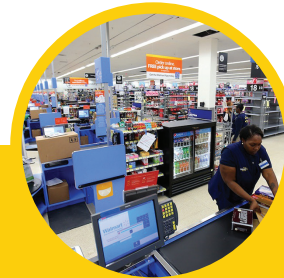
CAJAS DE COBRO