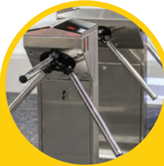
TORNIQUETES DE ACCESO