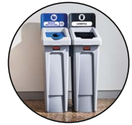
ESTACIÓN DE RECICLAJE SLIM JIM® 2 CONTENEDORES (DESECHOS Y RECICLAJE MIXTO) 2007914