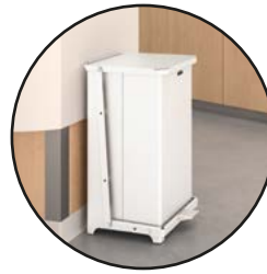
CONTENEDORES DE PEDAL DEFENDERS® FGST24EPLWH