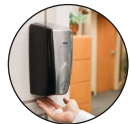
JABÓN DE MANOS EN ESPUMA Y DISPENSADOR DESINFECTANTE FG750139, 2080802 y FG750824