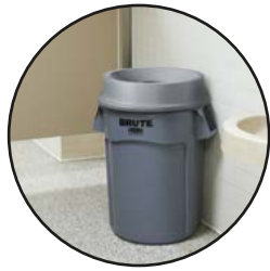
CONTENEDOR BRUTE® CON TAPA DE EMBUDO FG263200GRAY y FG354300GRAY