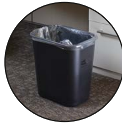
PAPELERAS MEDIANAS FG295600BLA