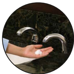
AUTOFAUCET® CON EL DISPENSADOR DE JABÓN ONESHOT® 1782743, 1938171 y FG750386